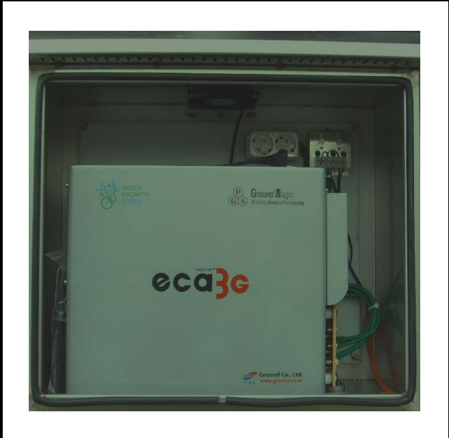
공사설명 11. 공도교위 댐하류영상카메라 장비설치