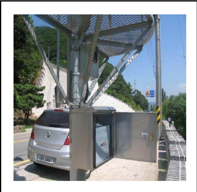
공사설명 14. 방류예경보 제2국 장비설치