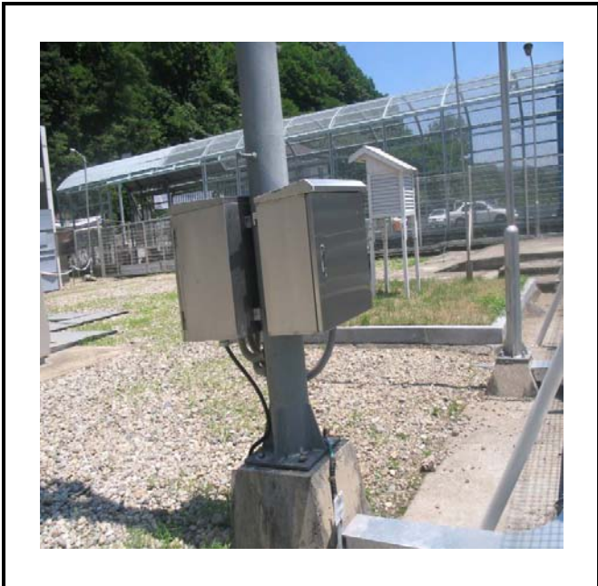
공사설명 7. 옥외S/S 원격감시카메라 합체설치