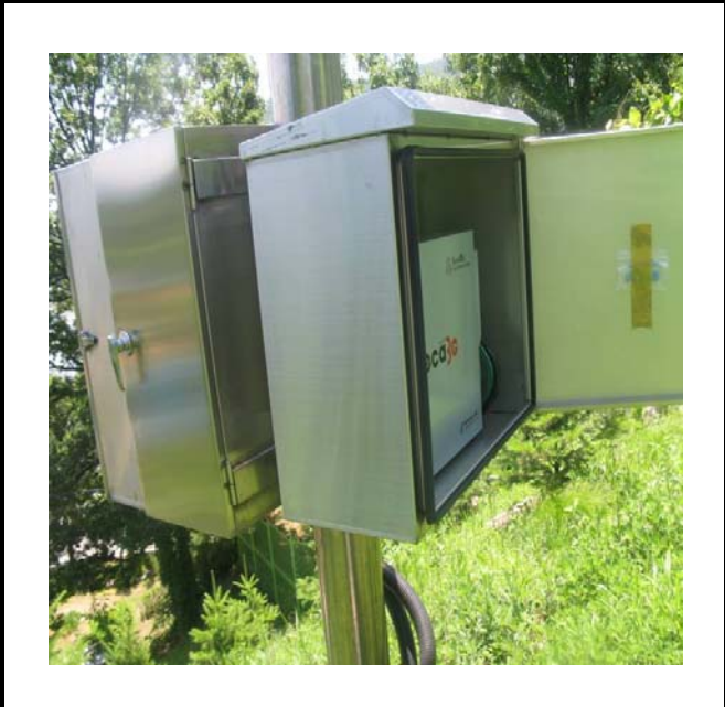
공사설명 8. 본관건너편 울타리감시카메라 장비설치