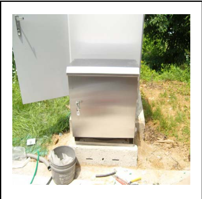
공사설명 16. 사택앞 옥외통신합체1 합체설치