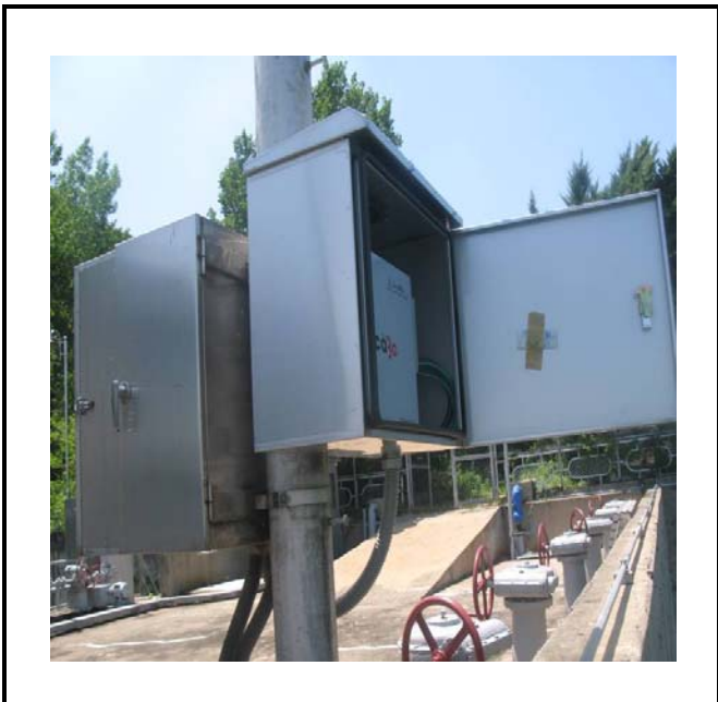
공사설명 5. 취수장 감시카메라 장비설치