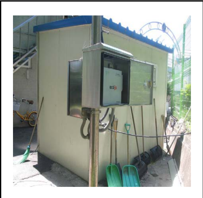
공사설명 10. 경비실뒤쪽 감시카메라 장비설치