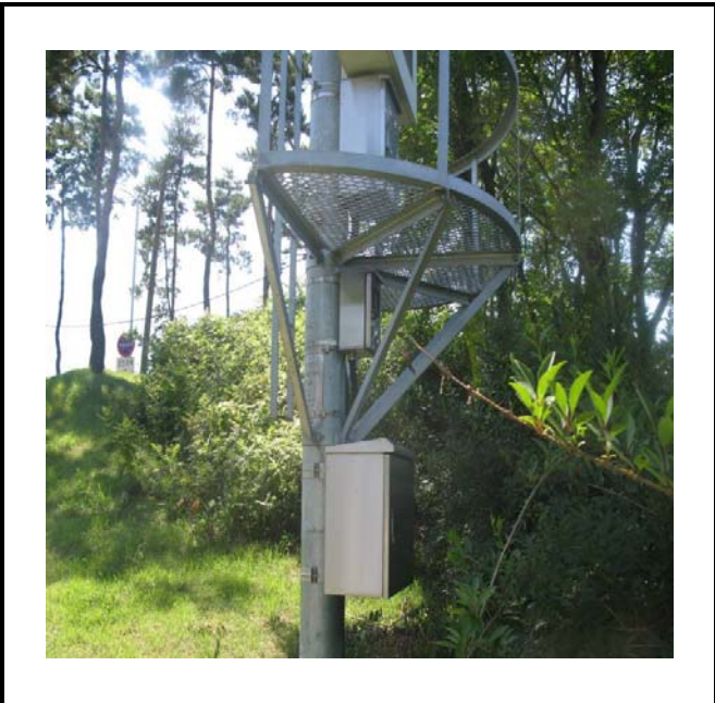
공사설명 15. 방류예경보 제3국 합체설치