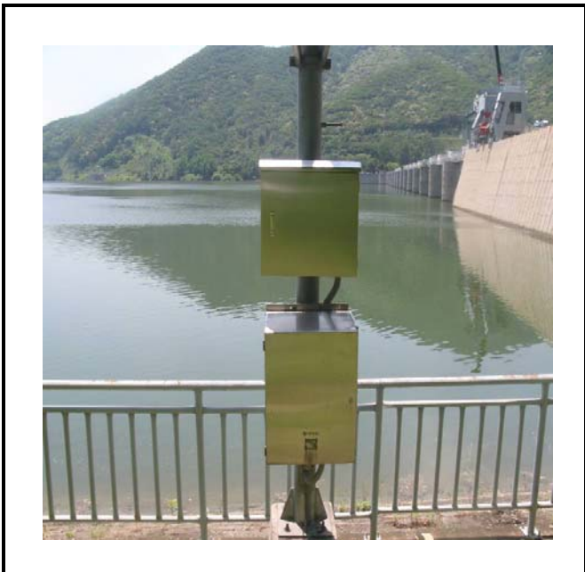
공사설명 2. 저수위 원격감시카메라 함체 설치