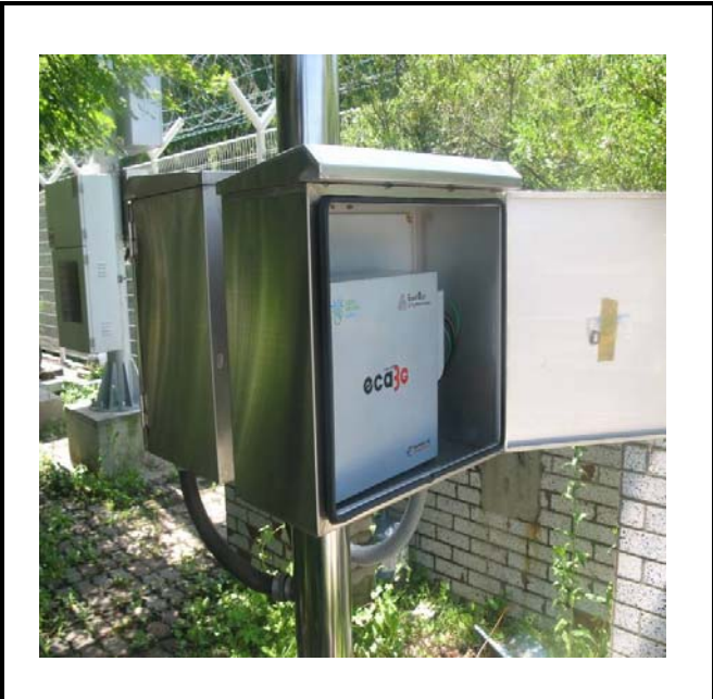
공사설명 12. 공도교끝초소 감시카메라 장비설치