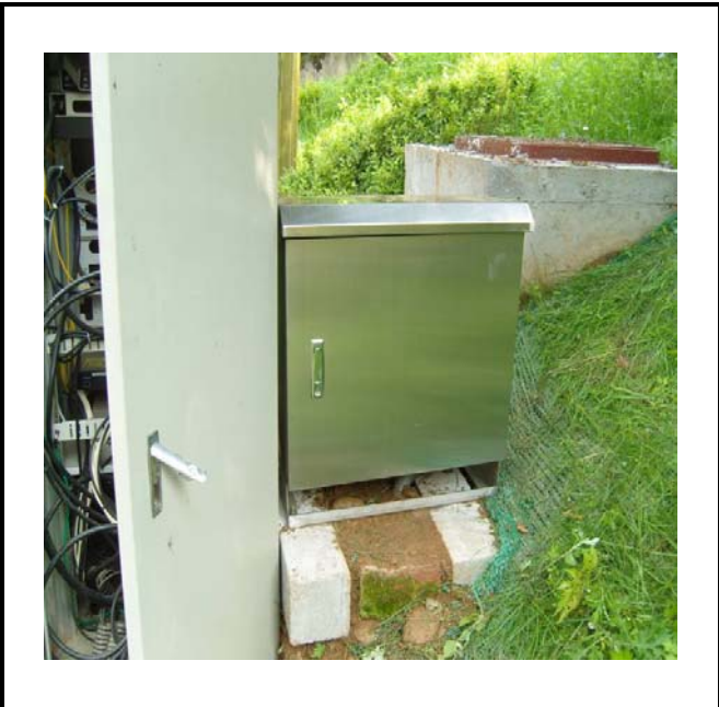
공사설명 18. 사택앞 옥외통신함체3 함체설치