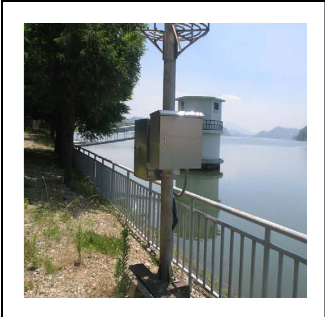
공사설명 1. 상류 호안감시카메라 함체설치