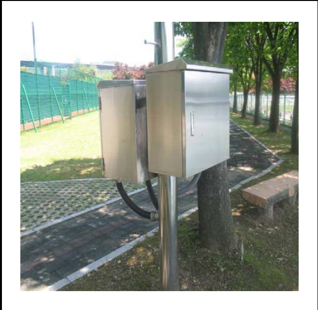
공사설명 9. 선착장 감시카메라 합체 설치