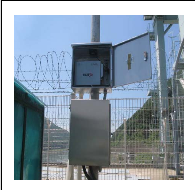
공사설명 3. 방수위탑 원격감시감시카메라 장비설치