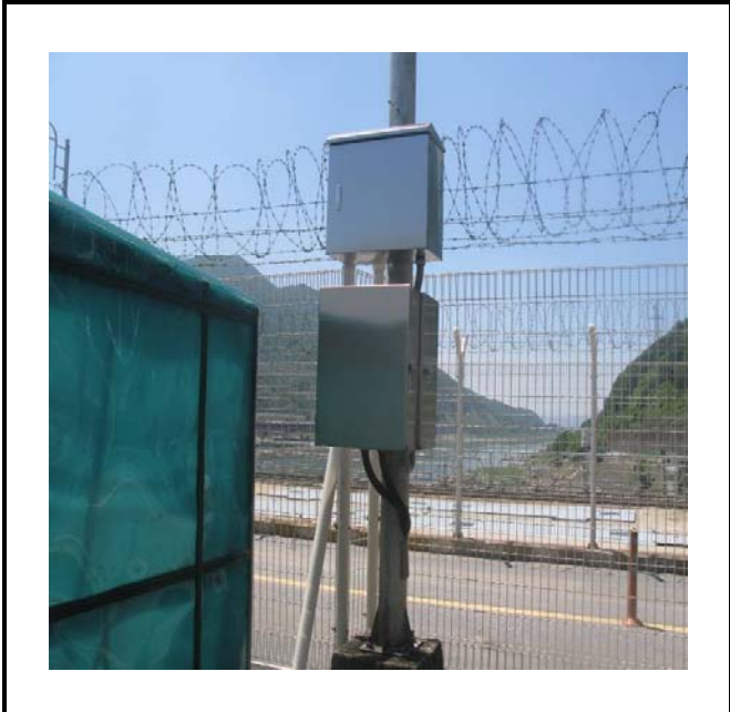
공사설명 3. 방수위탑 원격감시감시카메라 합체설치