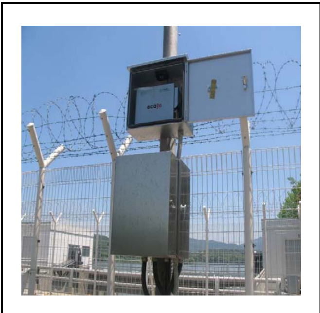
공사설명 4. 공도교 감시카메라 장비설치