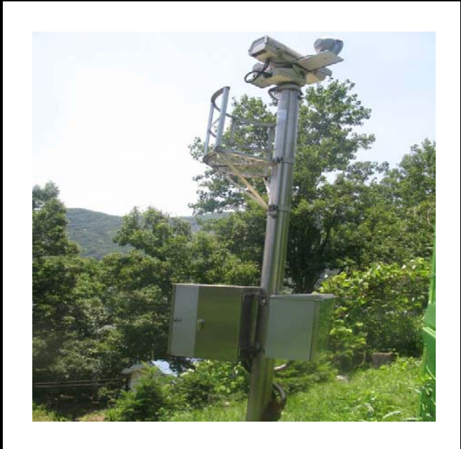
공사설명 8. 본관건너편 울타리감시카메라