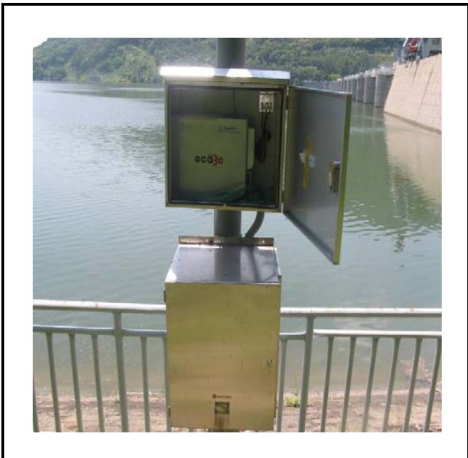
공사설명 2. 저수위 원격감시카메라 장비설치