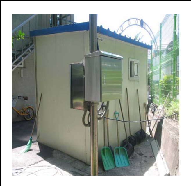
공사설명 10. 경비실뒤쪽 감시카메라 합체설치