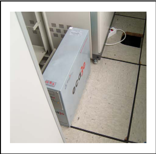
공사설명 19. 청명원 장비설치