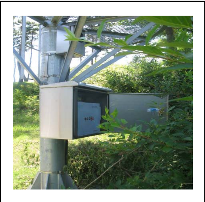
공사설명 15. 방류예경보 제3국 장비설치