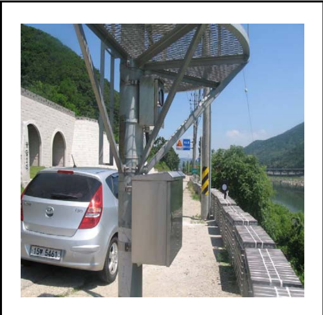
공사설명 14. 방류예경보 제2국 함체설치