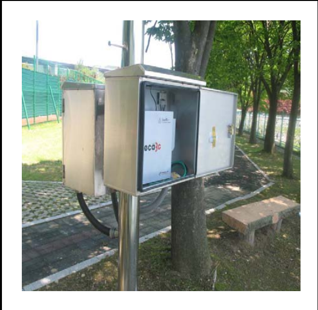
공사설명 9. 선착장 감시카메라 장비설치