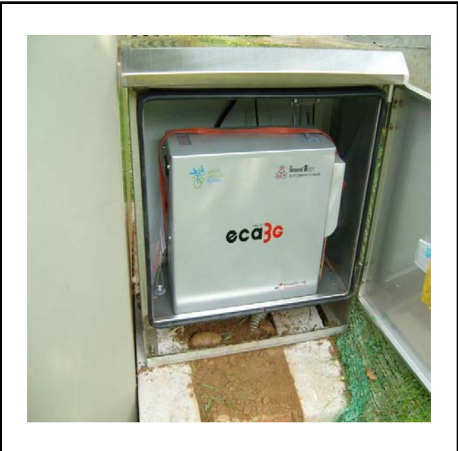
공사설명 18. 사택앞 옥외통신함체3 장비설치