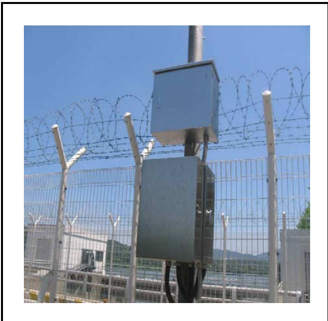
공사설명 4. 공도교 감시카메라 합체설치