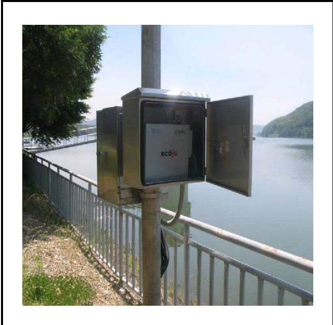
공사설명 1. 상류 호안감시카메라 장비설치