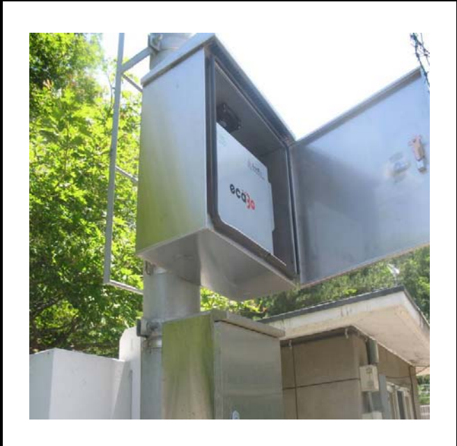
공사설명 13. 방류예경보 제1국 장비설치