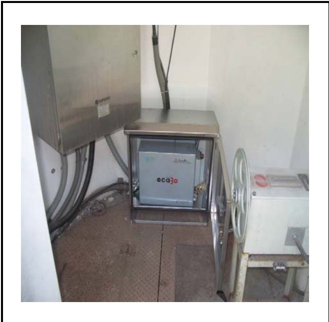
공사설명 6. 하류방류구 원격감시카메라 합체설치