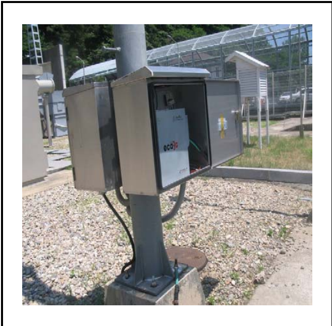
공사설명 7. 옥외S/S 원격감시카메라 장비설치