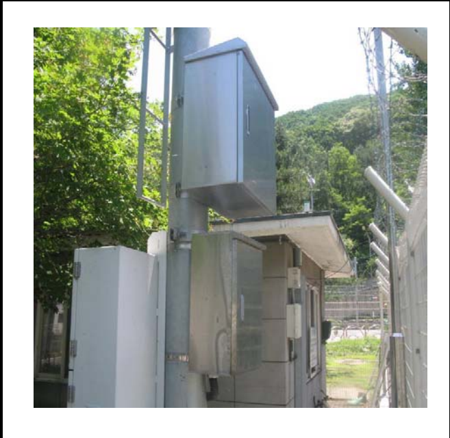
공사설명 13. 방류예경보 제1국 함체설치