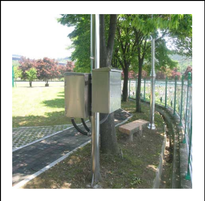
공사설명 9. 선착장 감시카메라