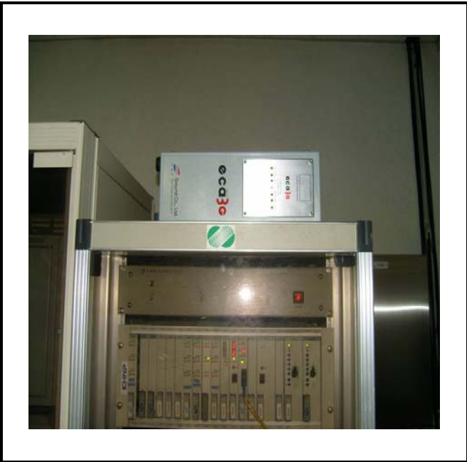
공사설명 20. 구배전반 장비설치