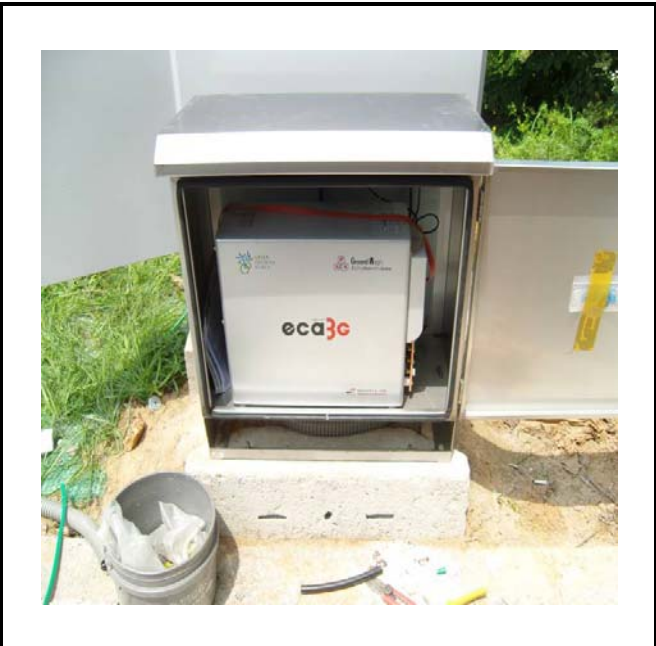
공사설명 16. 사택앞 옥외통신합체1 장비설치