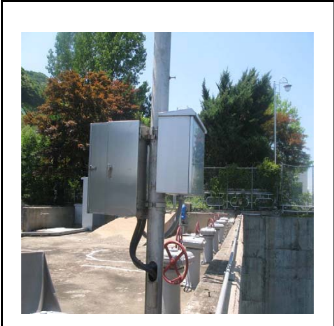
공사설명 5. 취수장 감시카메라 합체설치