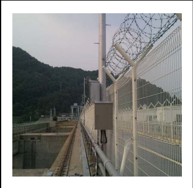
공사설명 11. 공도교위 댐하류영상카메라