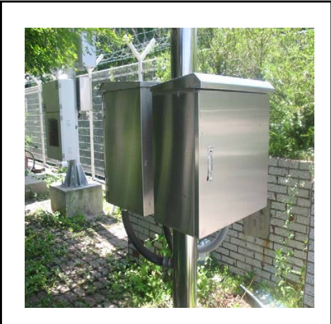
공사설명 12. 공도교끝초소 감시카메라