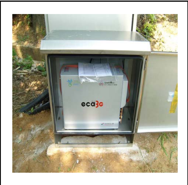
공사설명 17. 사택앞 옥외통신함체2 장비설치