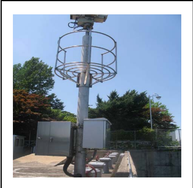
공사설명 5. 취수장 감시카메라