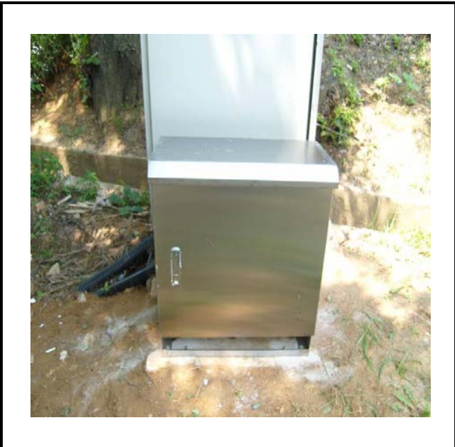
공사설명 17. 사택앞 옥외통신함체2 함체설치