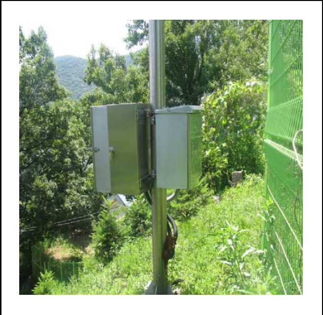
공사설명 8. 본관건너편 울타리감시카메라 합체설치