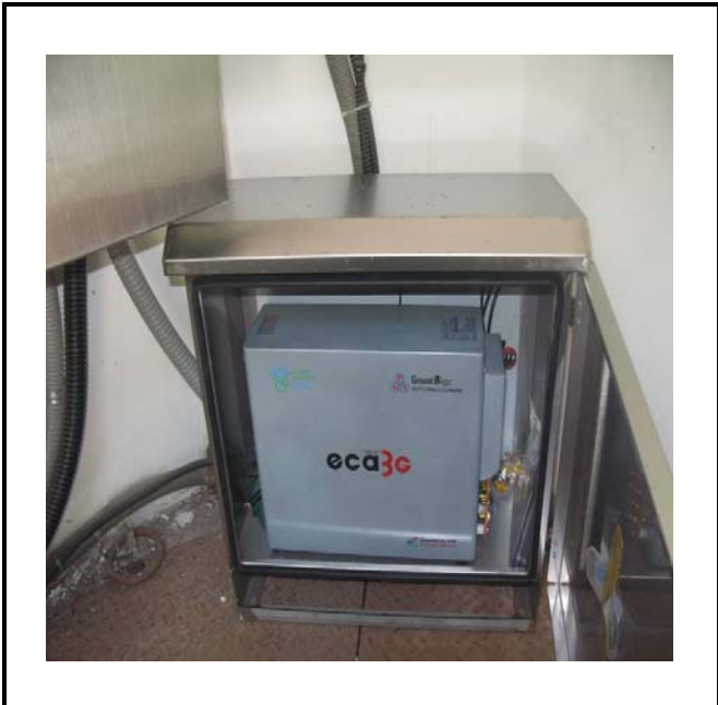
공사설명 6. 하류방류구 원격감시카메라 장비설치