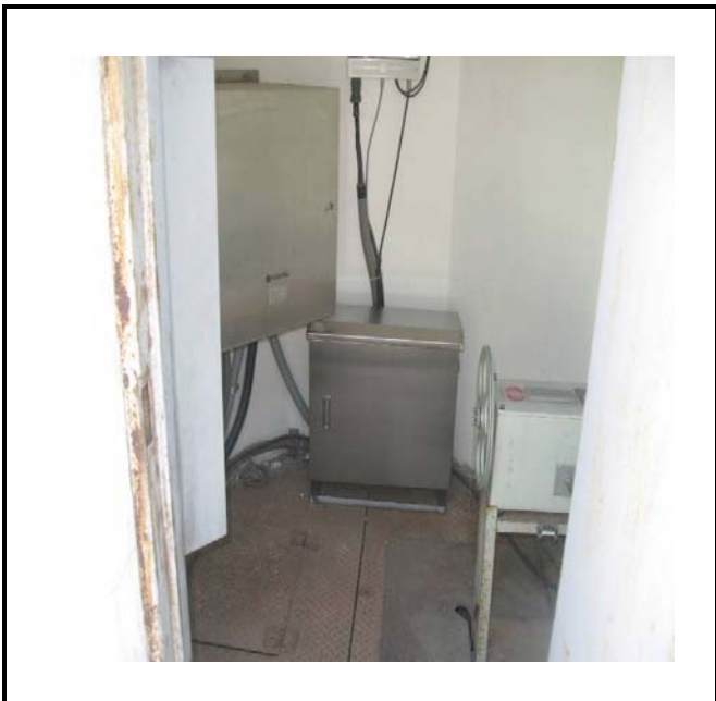
공사설명 6. 하류방류구 원격감시카메라 합체