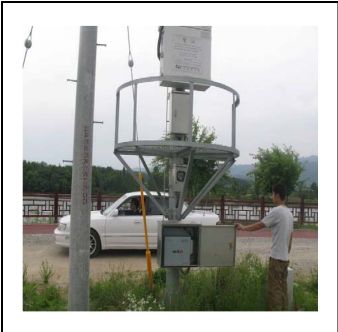
공사설명 17. 방류예경보 제 4국 장비설치