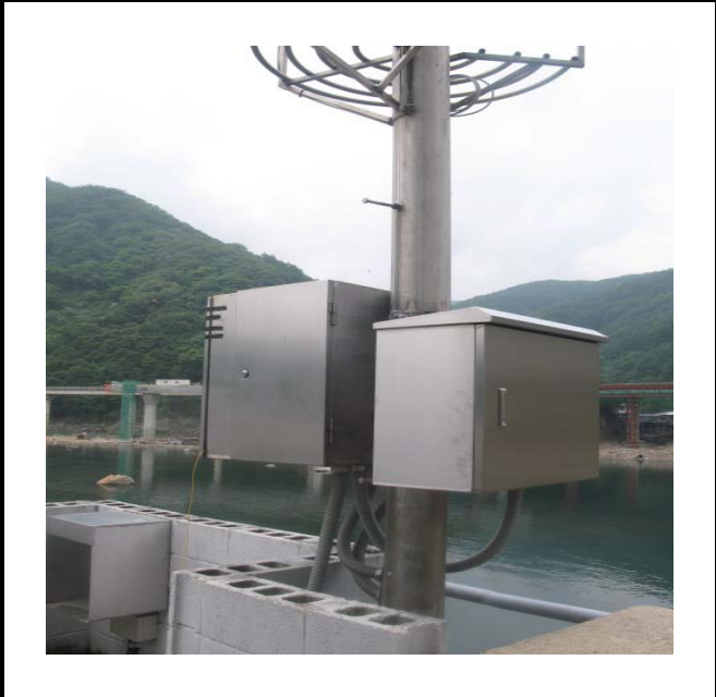
공사설명 11. 발전소 앞 방수구 감시카메라 합체설치