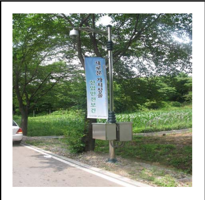
공사설명 12. 수력본부 진입로 감시 카메라 합체설치