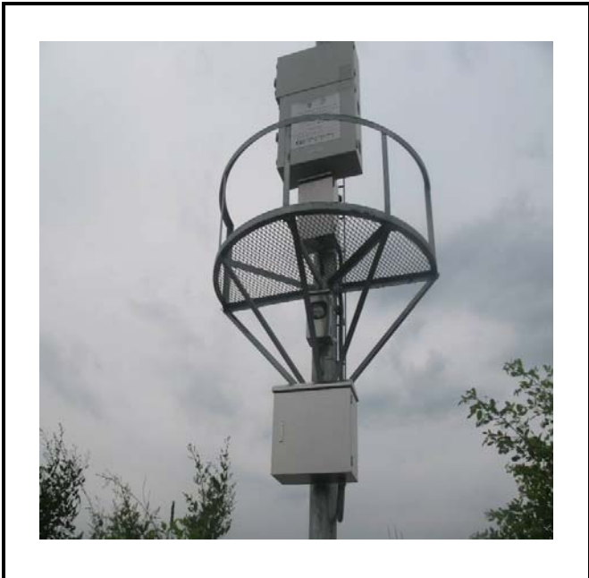
공사설명 16. 방류예경보 제3국 합체설치