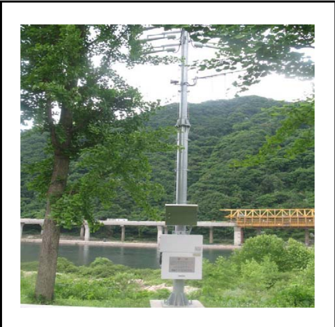
공사설명 14. 방류예경보 제1국 함체설치