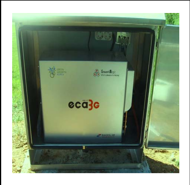
공사설명 13. 한울관 장비설치