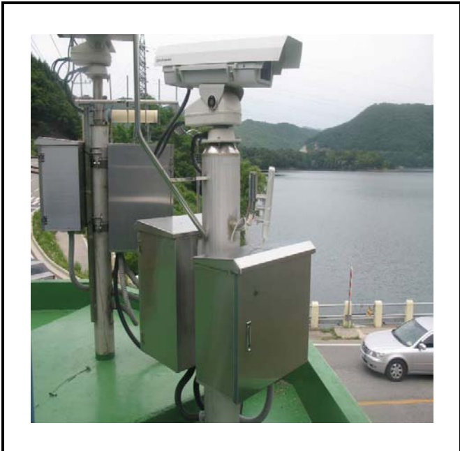
공사설명 3. 댐 하류 영상카메라 합체 설치