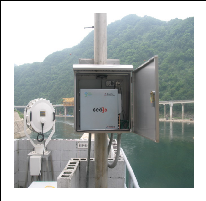
공사설명 11. 발전소 앞 방수구 감시카메라 장비설치