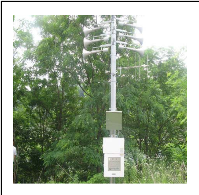
공사설명 15. 방류예경보 제2국 합체설치