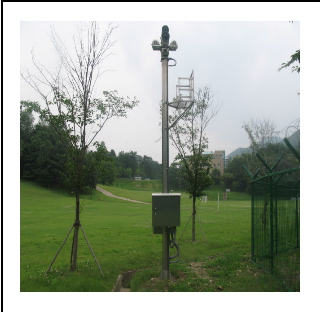
공사설명 6. 울타리 감시 적외선 카메라 합체설치