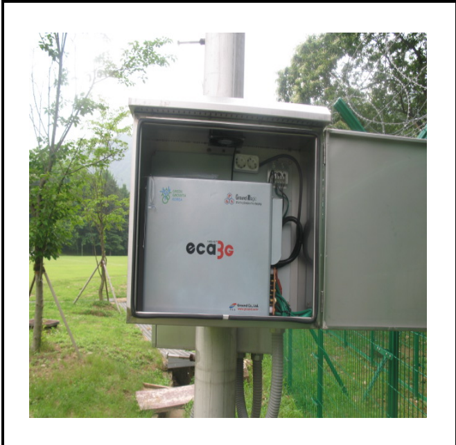
공사설명 7. 운동장 감시 카메라 장비설치