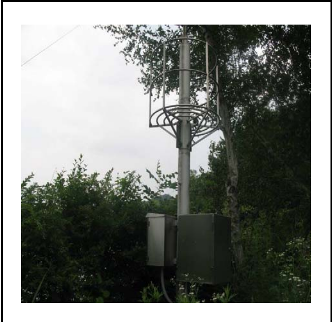
공사설명 1. 댐지구대 옆 주의감시 카메라 합체설치