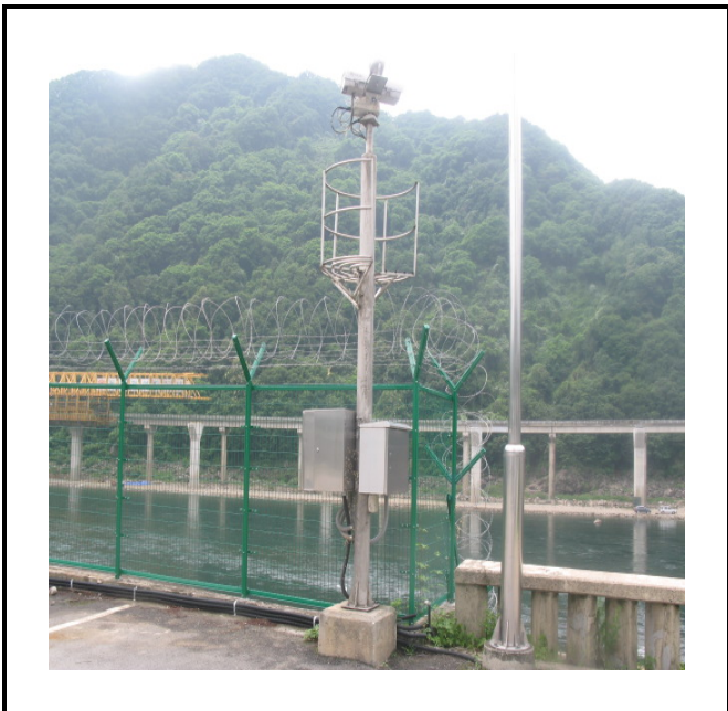
공사설명 8. 발전소 진입로 감시 카메라 함체설치