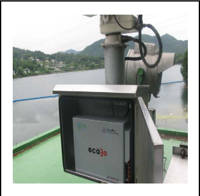
공사설명 2. 공도교 입구초소 감시 카메라 장비설치