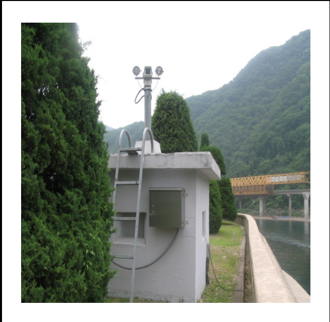
공사설명 9. 3초소위 감시 카메라 함체설치