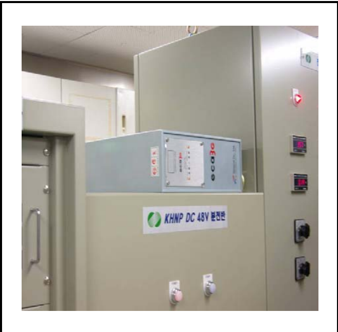
공사설명 20. 통신실 장비설치