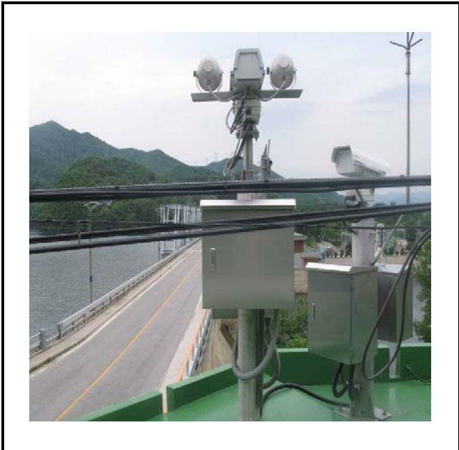
공사설명 4. 공도교 감시 카메라 합체설치