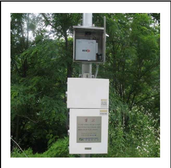
공사설명 15. 방류예경보 제2국 장비설치