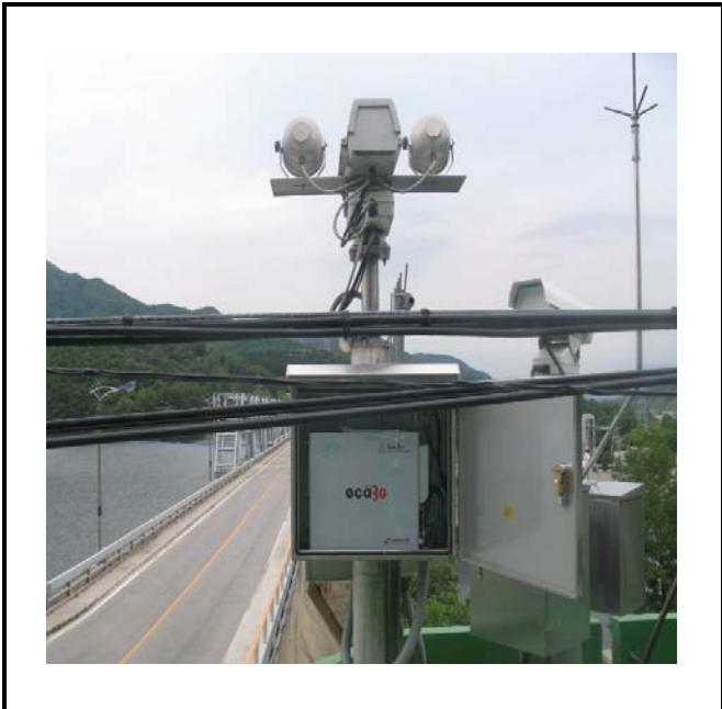
공사설명 4. 공도교 감시 카메라 장비설치