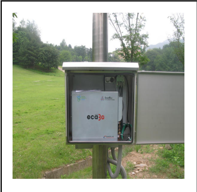
공사설명 6. 울타리 감시 적외선 카메라 장비설치