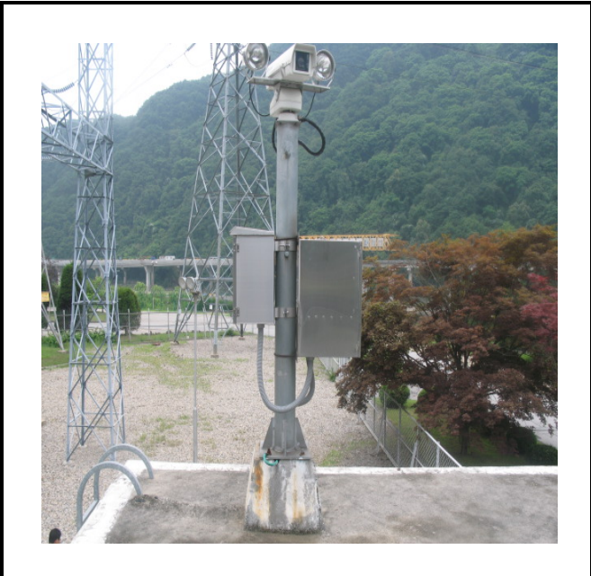
공사설명 10. 3초소앞 창고 옥상 카메라 함체설치