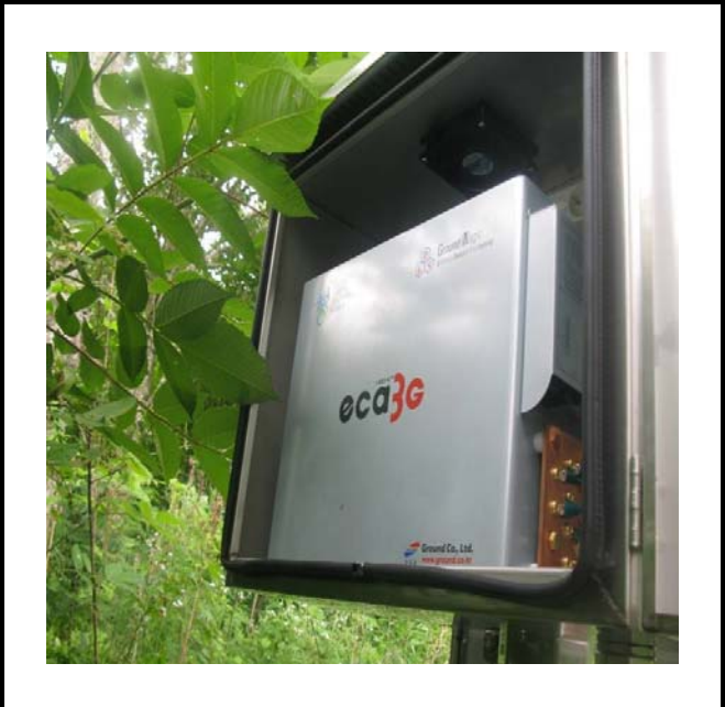
공사설명 1. 댐지구대 옆 주의감시 카메라 장비설치