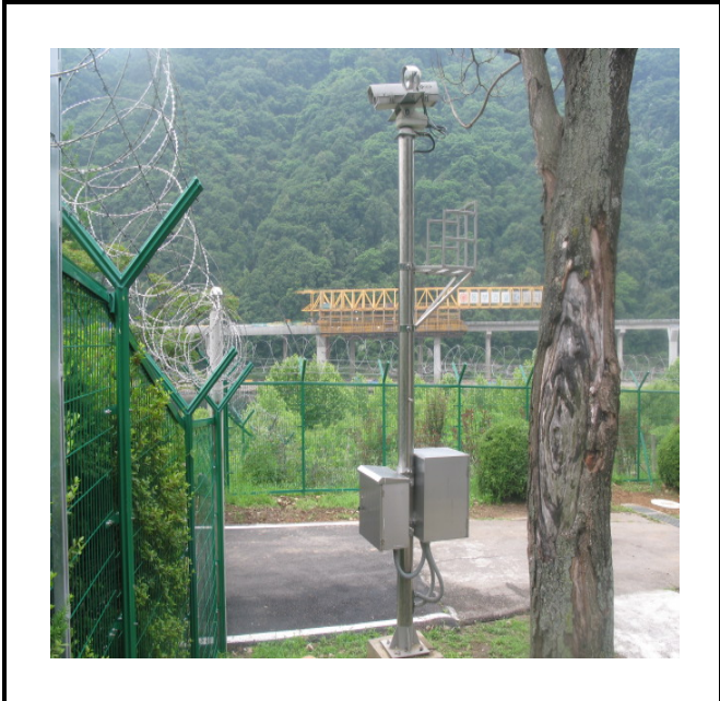
공사설명 5. 경비실 정문 감시 카메라 합체 설치