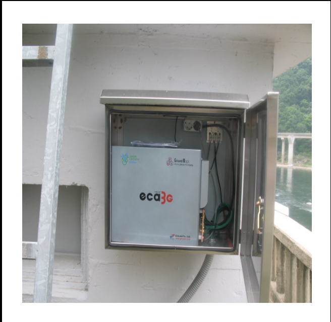
공사설명 9. 3초소위 감시 카메라 장비설치