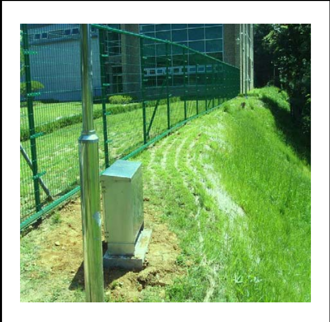
공사설명 13. 한울관 함체설치