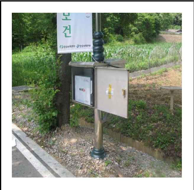
공사설명 12. 수력본부 진입로 감시 카메라 장비설치