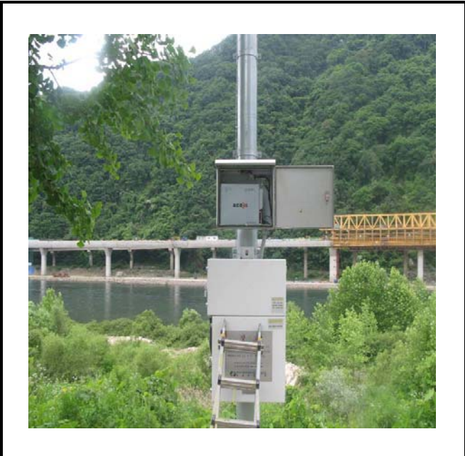
공사설명 14. 방류예경보 제1국 장비설치