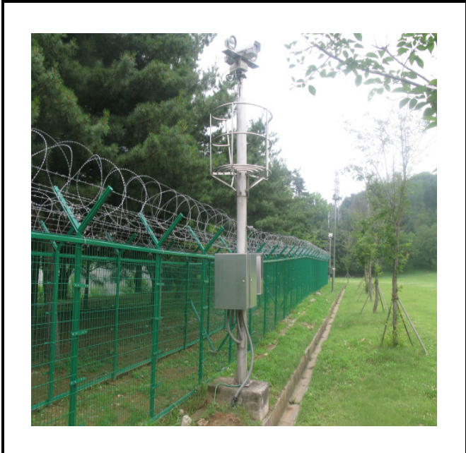
공사설명 7. 운동장 감시 카메라 함체설치