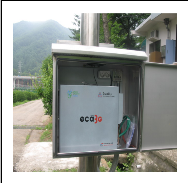
공사설명 5. 경비실 정문 감시 카메라 장비설치