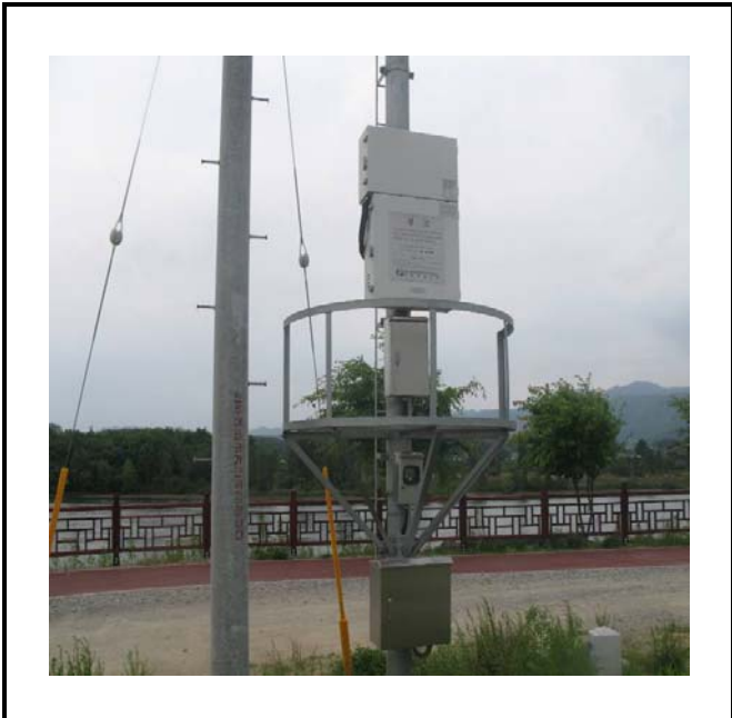
공사설명 17. 방류예경보 제 4국 합체설치