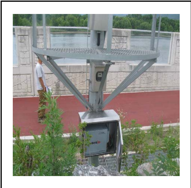
공사설명 18. 방류예경보 제5국 장비설치