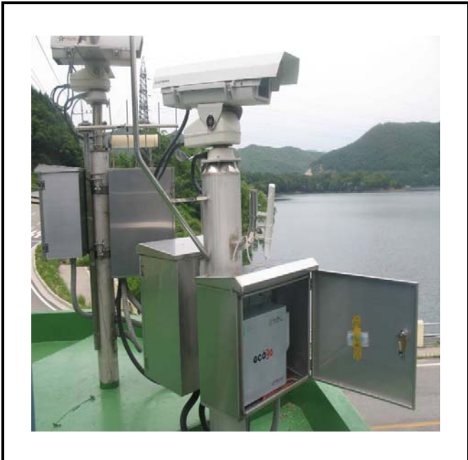
공사설명 3. 댐 하류 영상카메라 장비설치