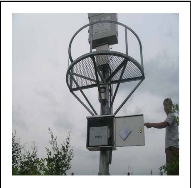
공사설명 16. 방류예경보 제3국 장비설치