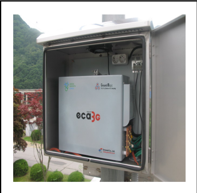
공사설명 10. 3초소앞 창고 옥상 카메라 장비설치