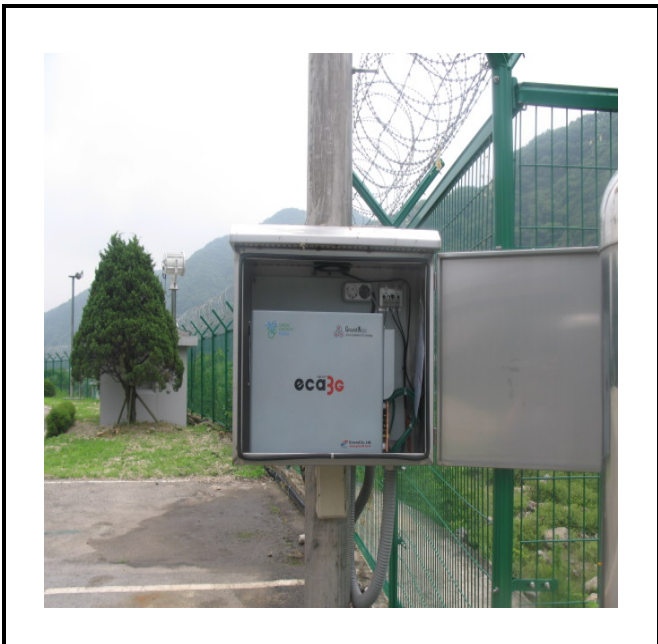
공사설명 8. 발전소 진입로 감시 카메라 장비설치