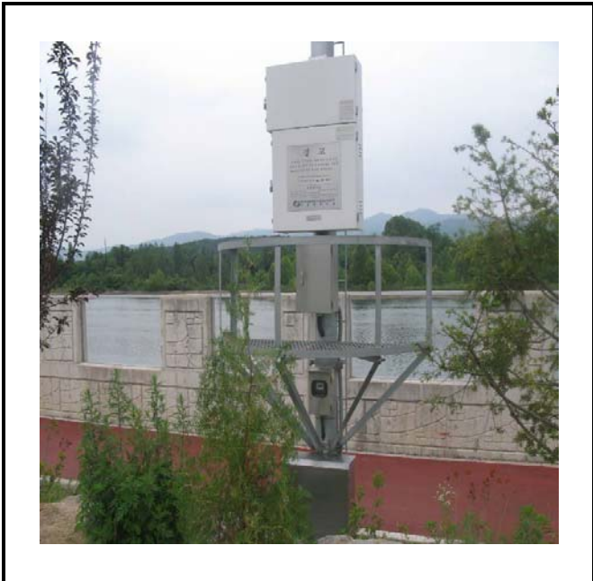
공사설명 18. 방류예경보 제5국 합체 설치