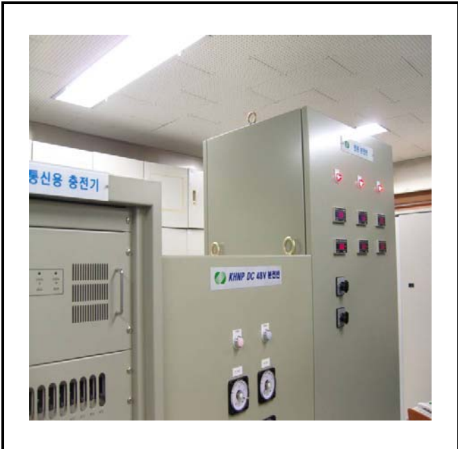
공사설명 20. 통신실