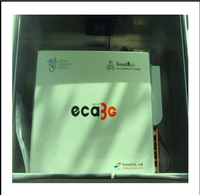
공사설명 12. 방류예경보 제2국 장비설치