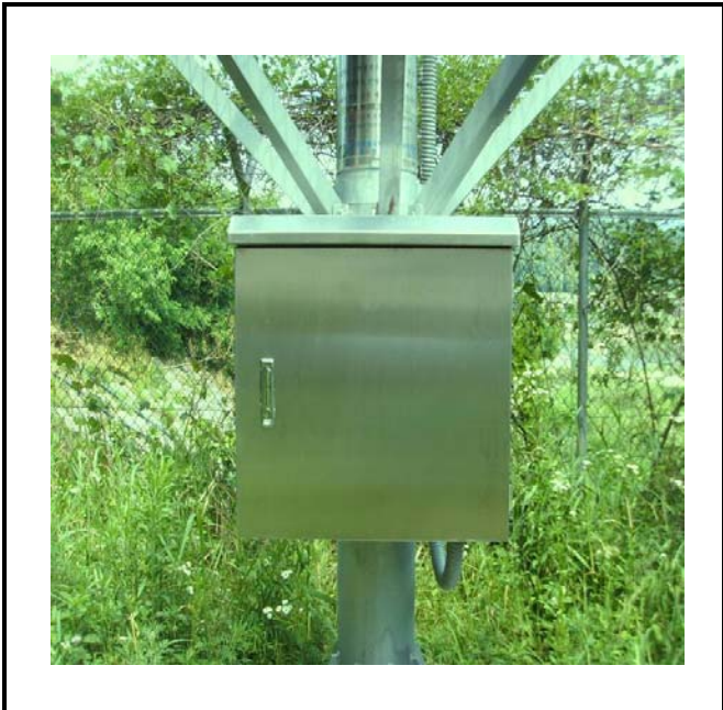
공사설명 | 11. 방류예경보 제1국 합체 설치