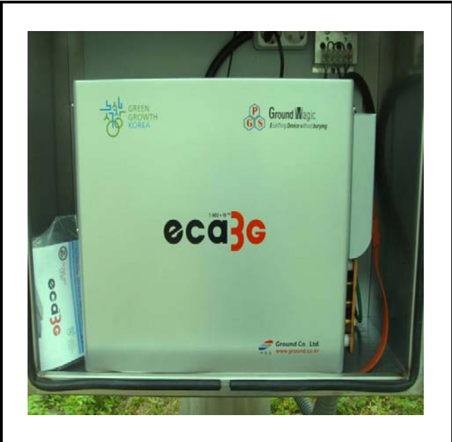
공사설명 7. 발전소 S/S올타리 감시 카메라 장비설치