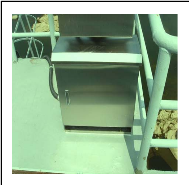
공사설명 3. 보성댐 하류영상 카메라 합체설치