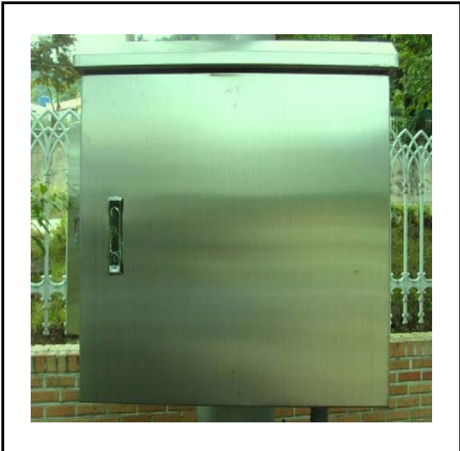
공사설명 | 10. 발전소 테니스장 입구 감시 카메라 합체설치