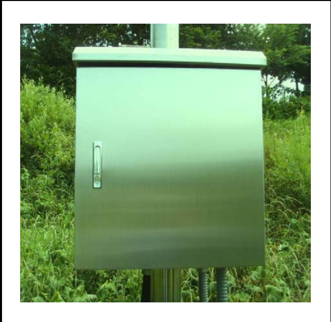
공사설명 6. 보성댐 우안 수문방류 감시 카메라 합체설치