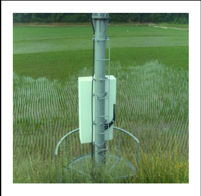
공사설명 13. 방류예경보 제3국