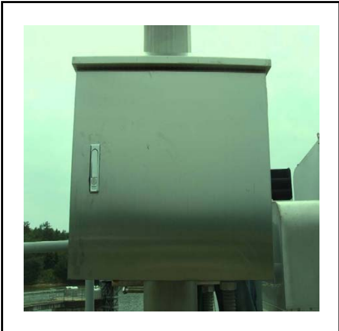
공사설명 2. 보성댐 공도교 앞 수위감시 카메라 합체 설치