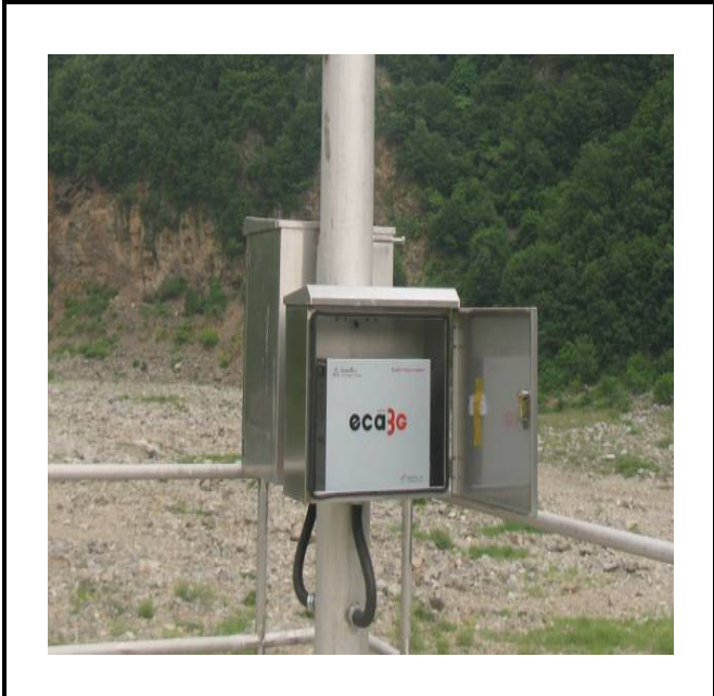
공사설명 4. 보성댐 공도교 끝 감시 카메라 장비설치