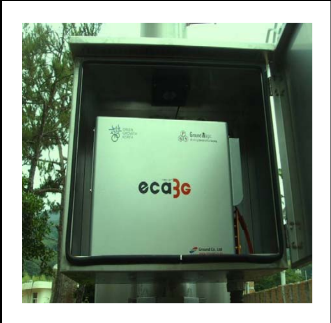
공사설명 8. 발전소 주차장 감시 카메라 장비설치