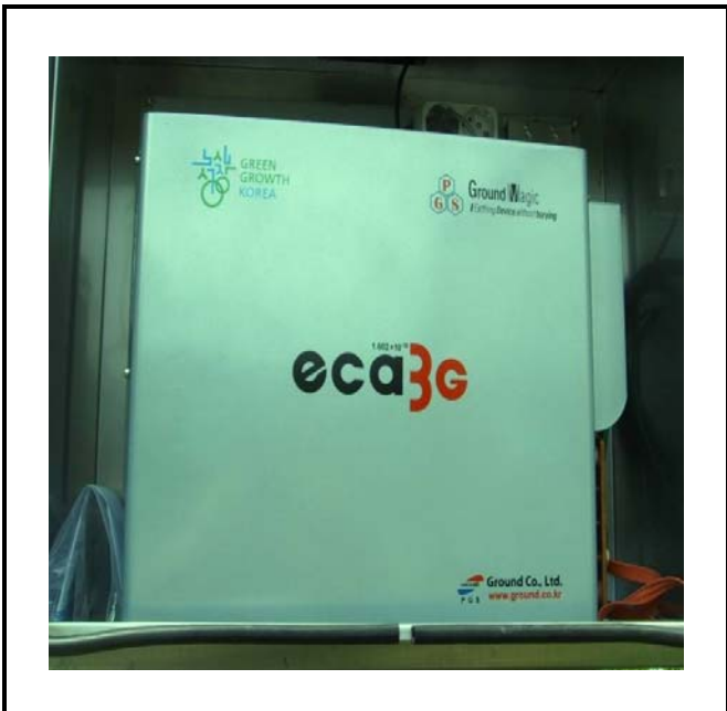
공사설명 5. 보성댐 좌안 수문방류 감시 카메라 장비설치