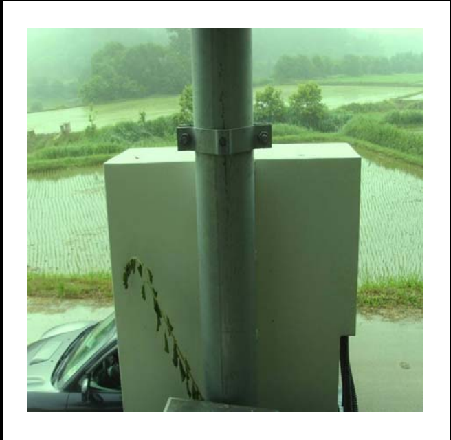
공사설명 12. 방류예경보 제2국