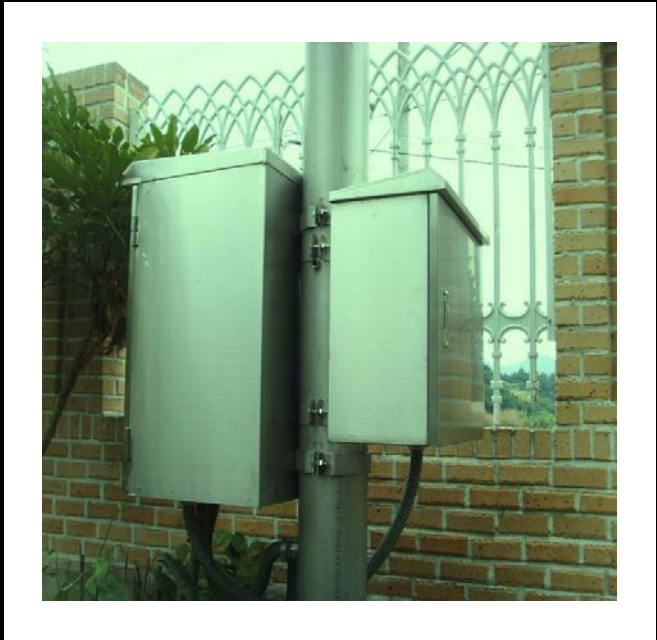
공사설명 8. 발전소 주차장 감시 카메라 합체설치