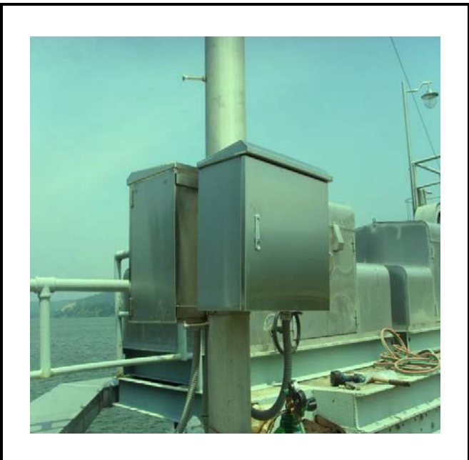
공사설명 2. 보성댐 공도교 앞 수위감시 카메라 합체 설치