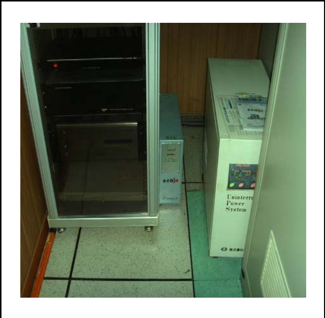
공사설명 14. MCR 장비설치