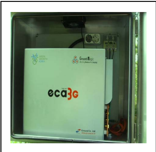
공사설명 1. 보성댐 정문감시 카메라 장비설치