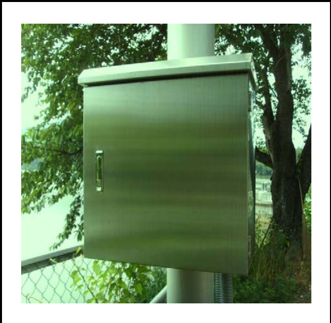
공사설명 1. 보성댐 정문감시 카메라 합체설치