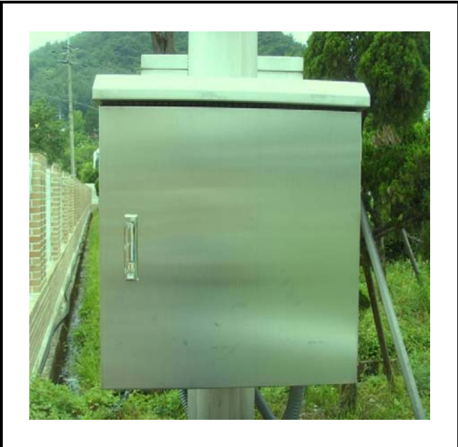
공사설명 7. 발전소 S/S올타리 감시 카메라 합체설치