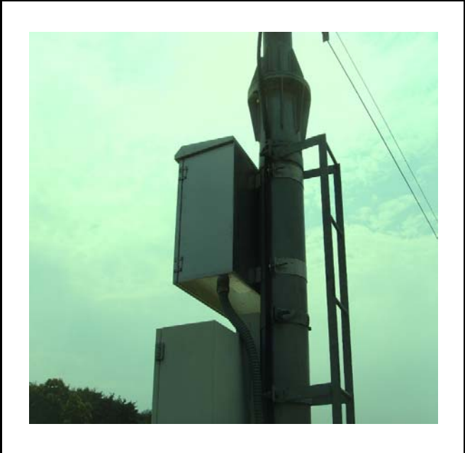
공사설명 13. 방류예경보 제3국 합체설치