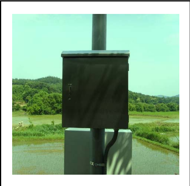
공사설명 12. 방류예경보 제2국 함체설치