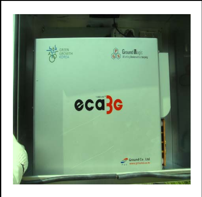
공사설명 13. 방류예경보 제3국 장비설치