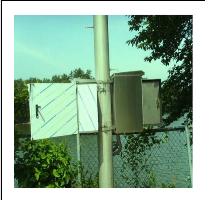
공사설명 1. 보성댐 정문감시 카메라 합체설치