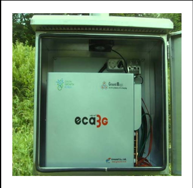
공사설명 6. 보성댐 우안 수문방류 감시 카메라 장비설치