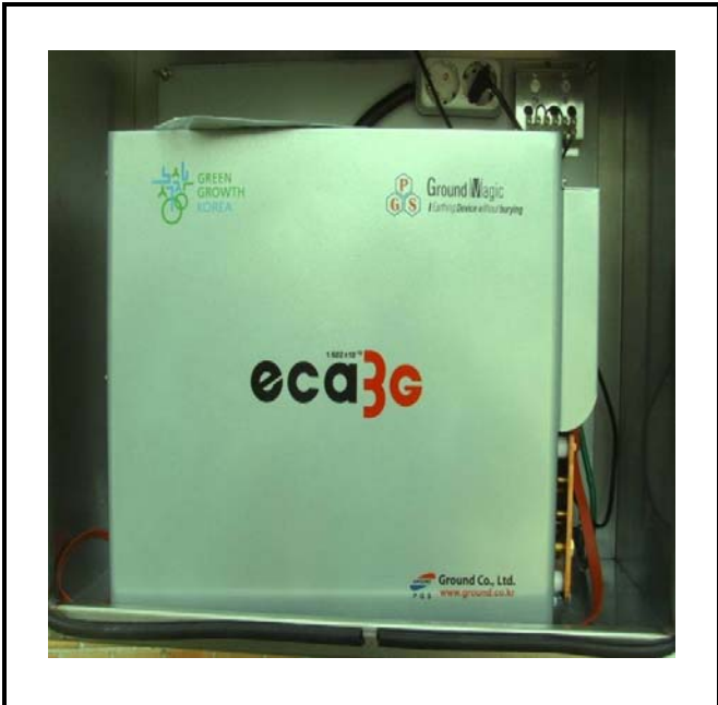
공사설명 | 10. 발전소 테니스장 입구 감시 카메라 장비설치