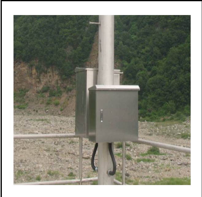
공사설명 4. 보성댐 공도교 끝 감시 카메라 합체설치