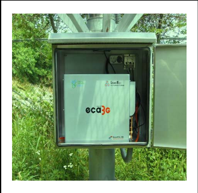
공사설명 11. 방류예경보 제1국 장비설치