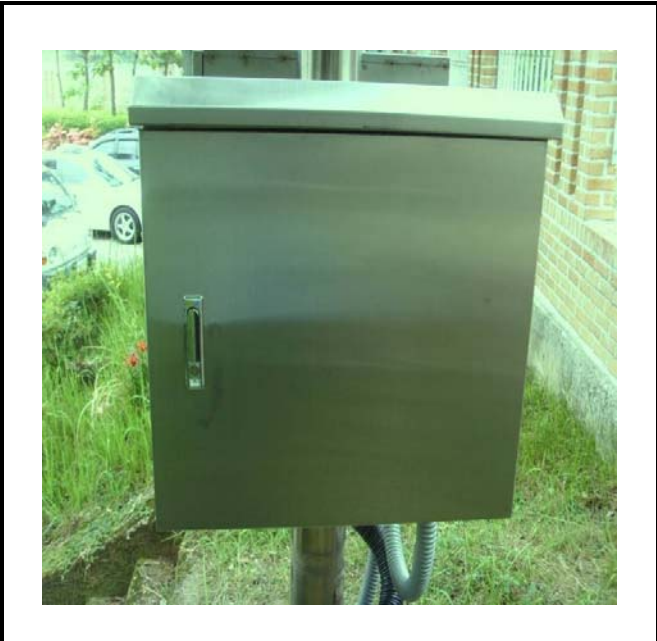
공사설명 9. 발전소 출입구 감시 카메라 합체설치