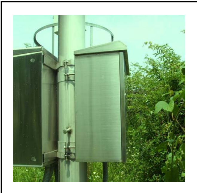
공사설명 5. 보성댐 좌안 수문방류 감시 카메라 합체설치