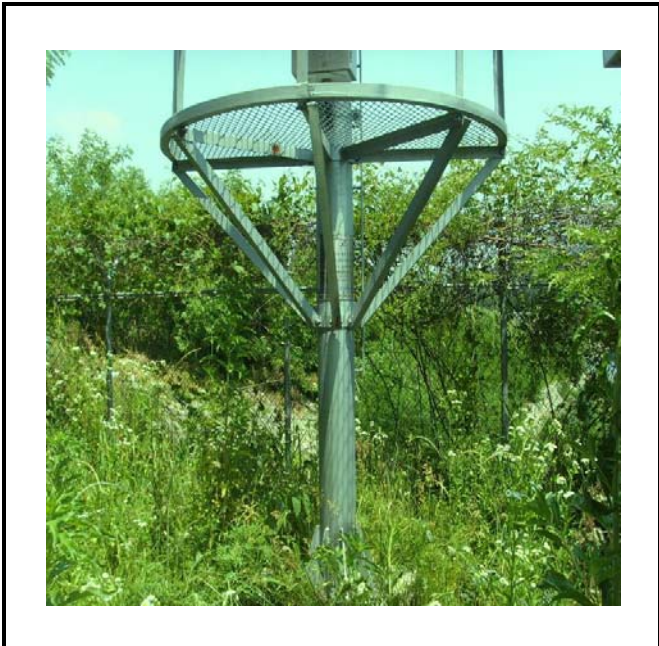
공사설명 | 11. 방류예경보 제1국