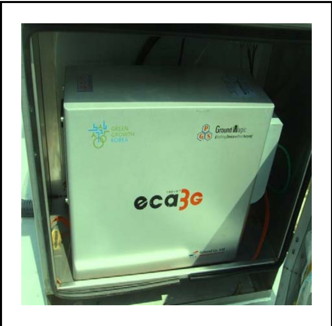
공사설명 3. 보성댐 하류영상 카메라 합체설치