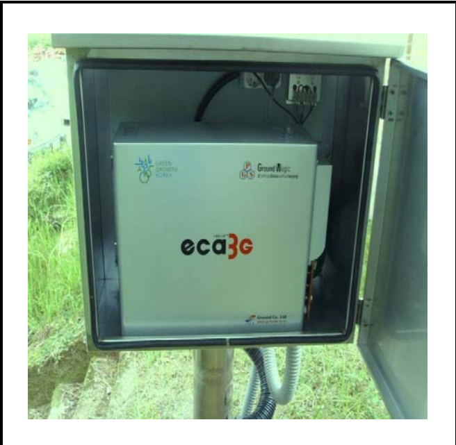
공사설명 9. 발전소 출입구 감시 카메라 장비설치